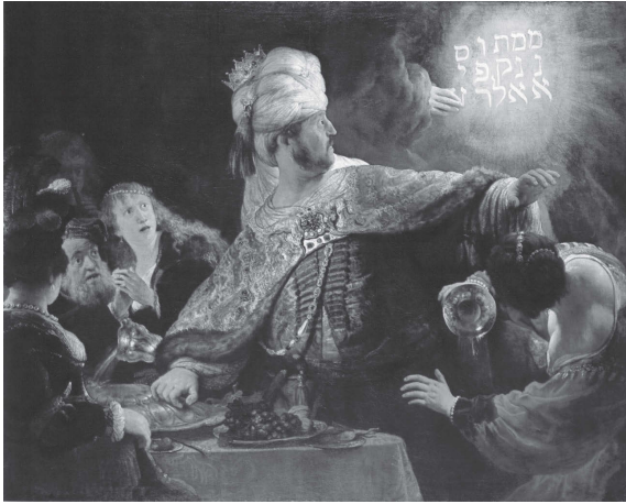
Abb. 2: Rembrandt von Rijn, Das Gastmahl des Belsazar, 1635, National Gallery London

Fremdwortes auf. So wurde der 11. September 2001 häufig als Menetekel eines neuen terroristischen Jahrhunderts bezeichnet oder in Unwettern meint man Menetekel der kommenden Klimakatastrophe erkennen zu können. Menetekel liegen momentan im wahrsten Sinne des Wortes »in der Luft«.